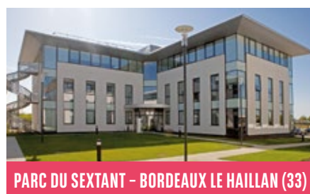
PARC DU SEXTANT - BORDEAUX LE HAILLAN (33)

Au cours du troisième trimestre 2018, le marché de l'investissement en France a marqué le pas, enregistrant 4,9 milliards d'euros contre 6,3 milliards d'euros au T3 2017. Cependant, grâce à un excellent 1 er semestre, le marché enregistre une hausse de 25% sur les 9 premiers mois de l'année comparativement à la même période de 2017. L'ensemble des classes d'actifs affichent de très bons résultats. Les bureaux restent la classe d'actifs privilégiée par les investisseurs : ils concentrent 70% des montants investis et affichent une hausse de 26% par rapport à 2017. Grâce à plusieurs transactions d'envergure et la vente de portefeuilles nationaux, les investissements en commerces s'élèvent à 2,4 milliards d'euros, en hausse de 14%. Les taux de rendement « prime » en bureau ont très peu évolué, ayant déjà atteint des niveaux très bas. Aucune baisse significative n'est attendue d'ici la fin de l'année. Le taux « prime » en bureaux dans Paris s'établit donc toujours à 3,0%.